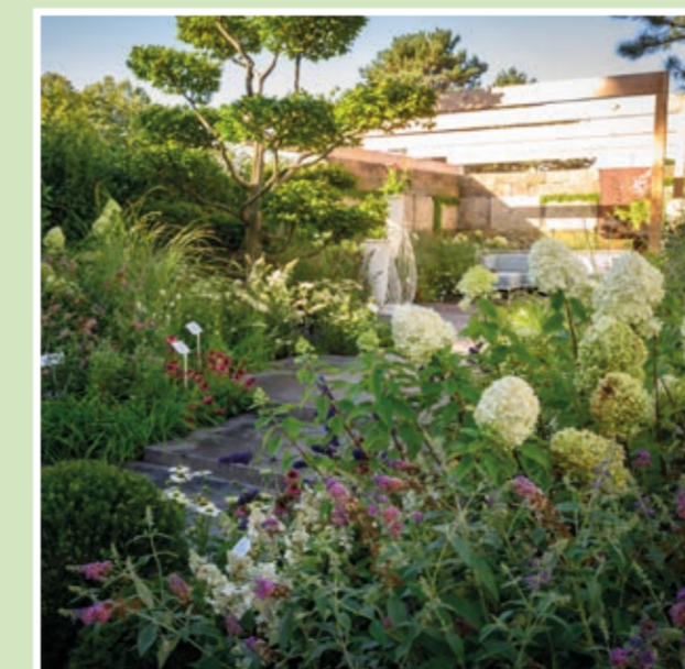
Freigelände Ost: Praskac Pflanzenland Schaugarten