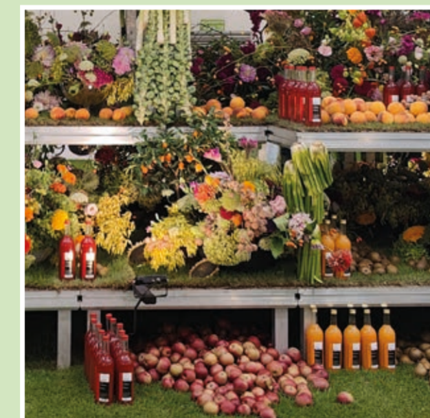
Halle 4: Obst & Gemüseschau, Pflanzen & Raritäten, Landwirtschaftskammer NÖ