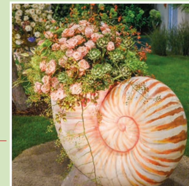
Halle 2: Rosenschau - Gärtner Starkl