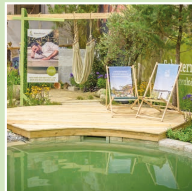
Halle 3: Kittenberger Erlebnisgärten