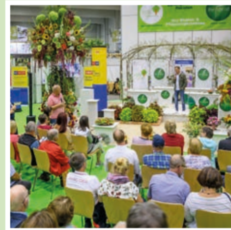
Halle 8: Floristikshows & Gartengestaltung