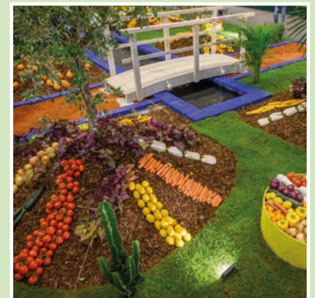
Halle 2: Gemüse-Show