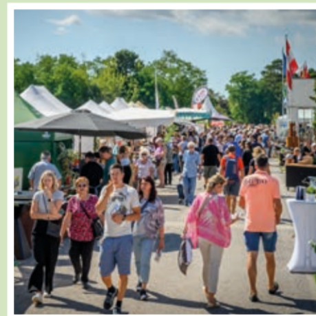
Halle 4: Obst & Gemüseschau, Pflanzen & Raritäten, Landwirtschaftskammer NÖ