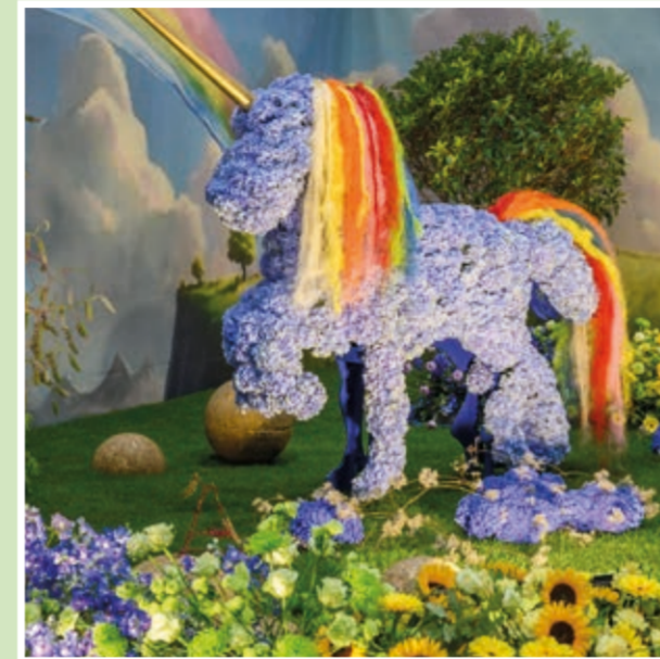
Halle 1: Europas größte Blumenschau