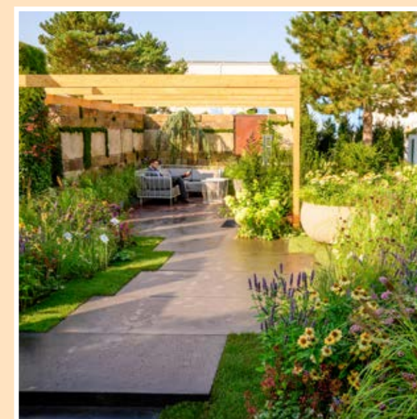
Otevřené prostranství - východ: Ukázková zahrada Praskac Pflanzenland