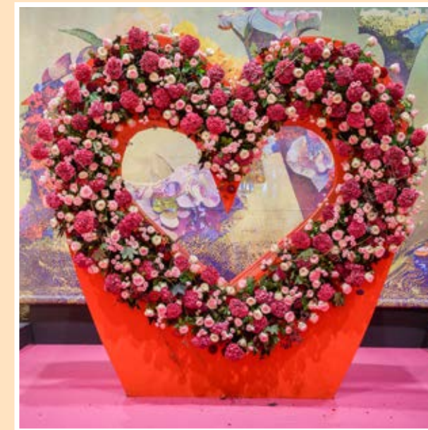
Hala 1: Největší evropská výstava květin