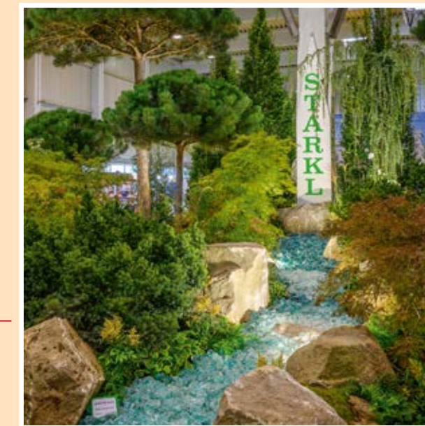
Hala 2: Výstava růží - Zahradnictví Starkl