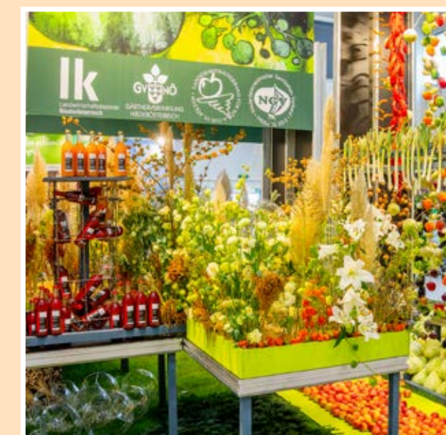
Hala 4: Výstava ovoce a zeleniny, rostliny a rarity, Agrární komora Dolního Rakouska