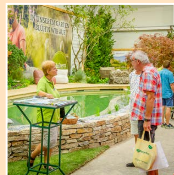
Hala 3: Zážitkové zahrady Kittenberger