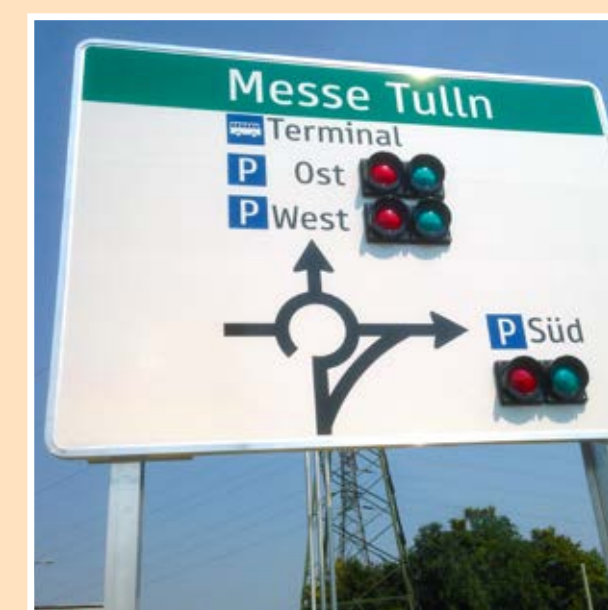
Naváděcí cedule k více než 100 parkovacím místům pro autobusy