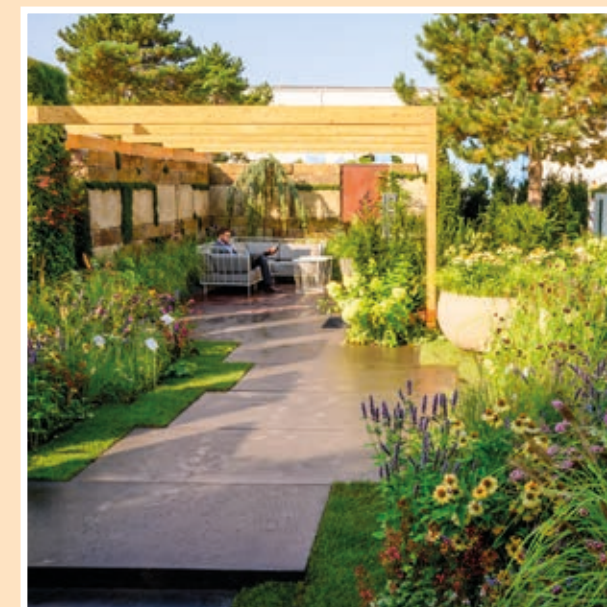
Freigelände Ost: Praskac Pflanzenland Schaugarten