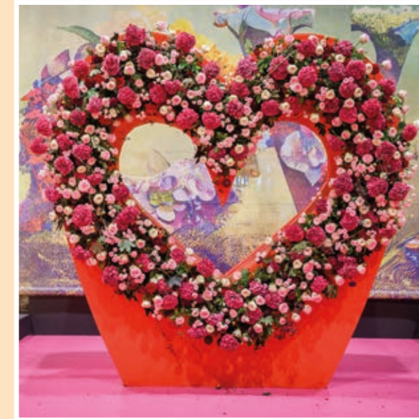
Halle 1: Europas größte Blumenschau