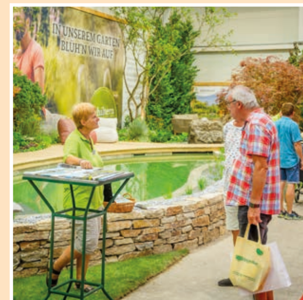
Halle 3: Kittenberger Erlebnisgärten