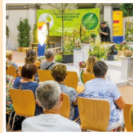
Halle 8: Floristikshows & Gartengestaltung

Halle 4: Obst & Gemüseschau, Pflanzen & Raritäten - Landwirtschaftskammer NÖ