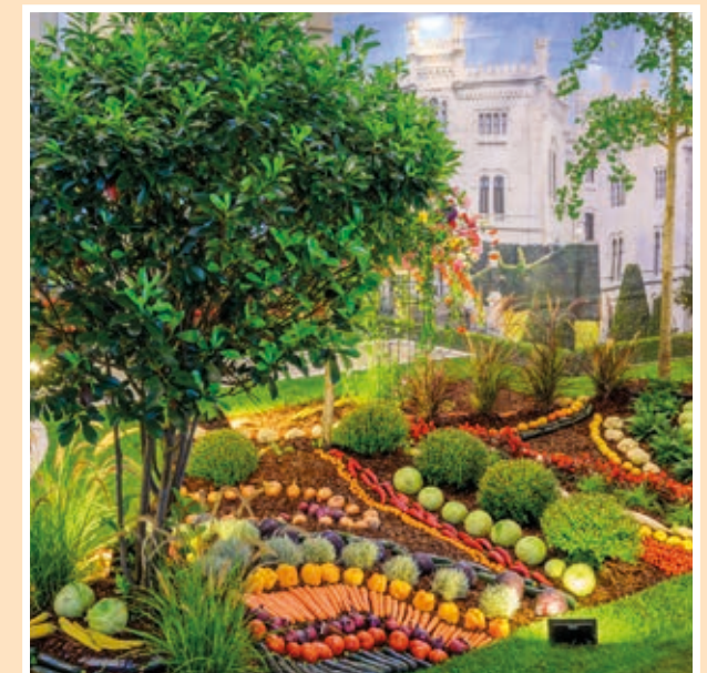
Halle 2: Gemüseschau