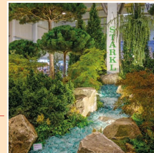
Halle 2: Sonderschau - Gärtner Starkl