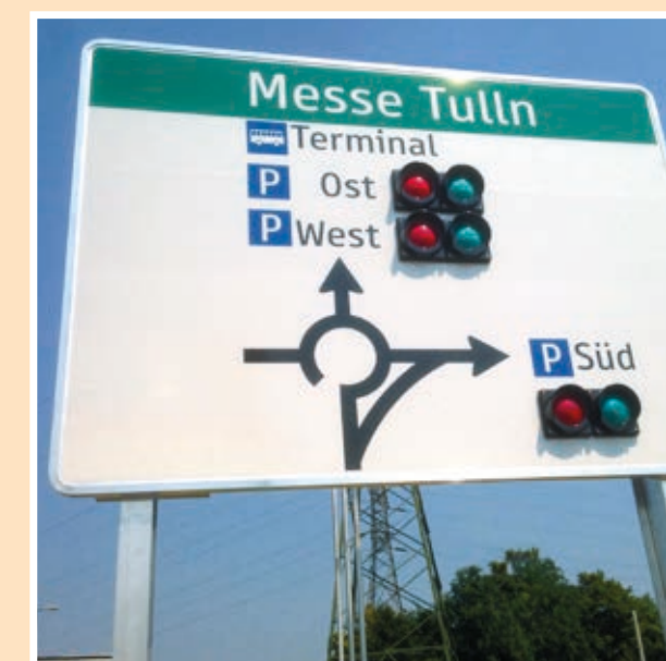
Verkehrssystem zu über 100 Busparkplätzen