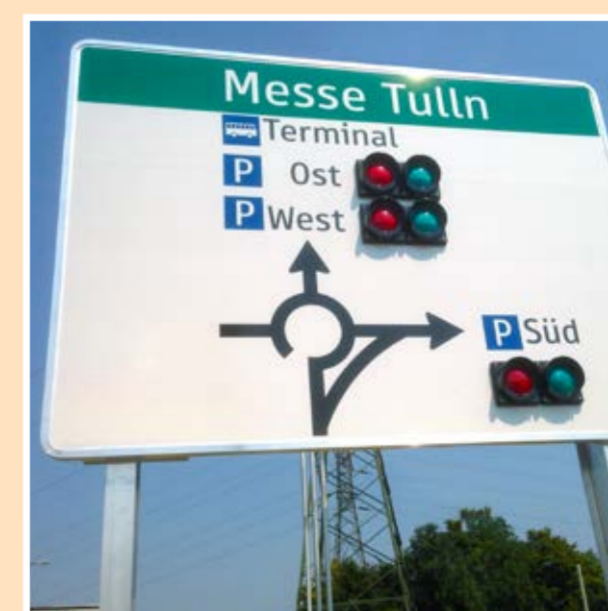
Riadený systém dopravy s viac ako 100 parkovacími miestami pre autobusy