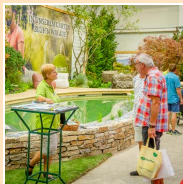
Hala 3: Zážitkové záhrady Kittenberger