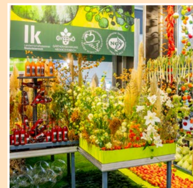
Hala 4: Výstava ovocia a zeleniny, svet rastlín a rarity, Poľnohospodárska komora Dolné Rakúsko