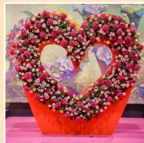
Hala 1: Najväčšia výstava kvetov v Európe